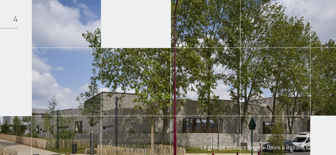
Le groupe scolaire Angela-Davis à Bezons