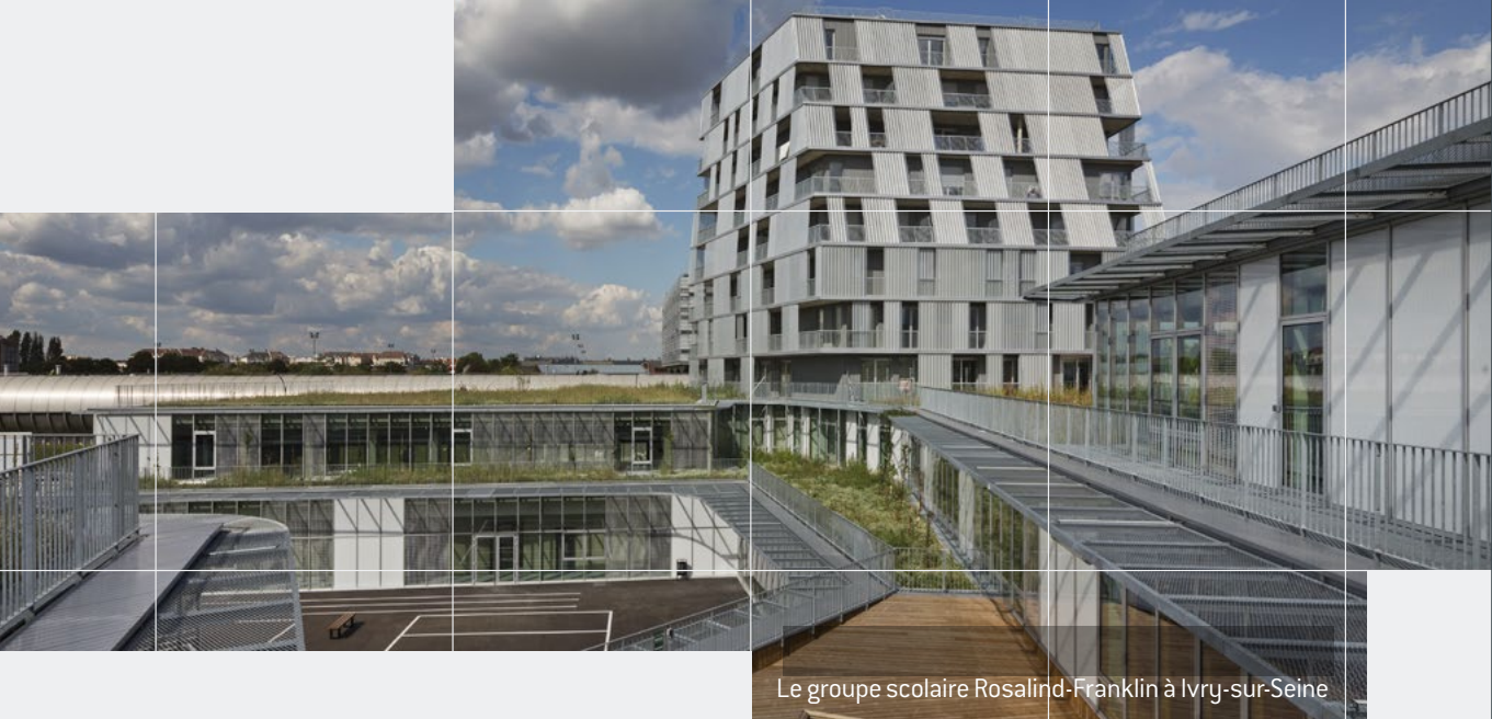
Le groupe scolaire Rosalind-Franklin à Ivry-sur-Seine